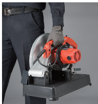
Tay cầm dễ vận chuyển